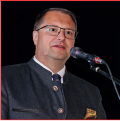
Heiko Hain, MdB, plädierte dafür, dass es bei der Evaluierung des Waffenrechts keine Waffenrechtsverschärfungen geben darf.

Über 700 Schützenvereinen wurde so eine solide schießsportliche Heimat ermöglicht, davon 66 in Oberfranken. Aufgrund eines Antragsstaus sind aber nach wie vor 44 dieser 66 Anträge mit einem Gesamtvolumen von 756.000 Euro noch nicht abfinanziert. Im sportlichen Bereich verwies Albert Euba auf die hohe Leistungsfähigkeit des bayerischen Schießsports – von internationalen Erfolgen bis hin zu großen Wettbewerben auf der Olympia-Schießanlage in Garching. Gleichzeitig werde mit gezielter Nachwuchsarbeit, neuen Disziplinen und innovativen Projekten wie Schulkooperationen aktiv in die Zukunft investiert.