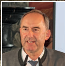
Staatsminister Hubert Aiwanger